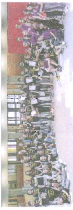
Sorgten für einen musikalisch hochinteressanten Abend: Die jungen Musikerinnen und Musiker der Friedrich-Bayer-Realschule.